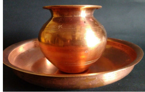
படம் 1: வீட்டு உபயோக தாமிரப் பாத்திரங்கள்

தொலைத்தொடர்பு, மின்சார இணைப்பு, போக்குவரத்து, பாத்திரங்கள், கட்டுமானம் போன்றவற்றில் இன்று தாமிரம் பயன்படுத்தப்படுகிறது. நம்முடைய வீடுகளில், கம்பிகள், தண்ணீர் சேமிக்க மற்றும் சாப்பிடப் பயன்படுத்தும் பாத்திரங்கள் என பலவாறாக தாமிரப் பொருள்கள் பயன்படுத்தப்படுகின்றன. எனினும், தாமிரத்திலுள்ள ஒரு குறிப்பிட்ட குறைபாட்டினால் அதன் பயன்பாடு நம்முடைய வாழ்வில் குறைந்துவருகிறது. தாமிரத்தின் பயன்பாட்டை குறையச்செய்த இந்தக் குறைபாட்டை இப்பிரிவு விவரிக்கிறது.