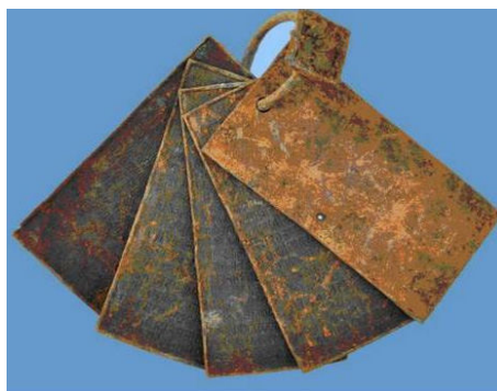
Image 2: Statue of Buddha discovered in Sultanganj, Bihar (left). Copper plates of Kalachuri dynasty (right)