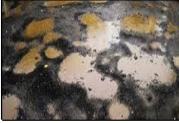
Figure 3: Puddles