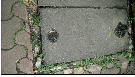
Figure 1: Drainage cover