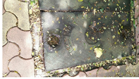
Figure 2: Drainage cover