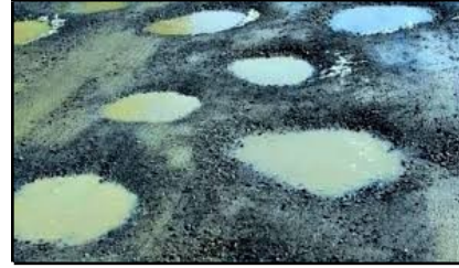
Figure 4: Puddles